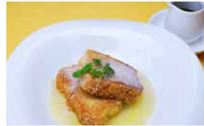
364 フレンチ台湾カステラ ¥680