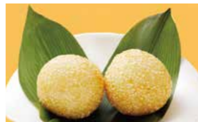
365 ゴマ団子 ¥560