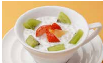
363 タピオカ入りココナッツミルク ¥400