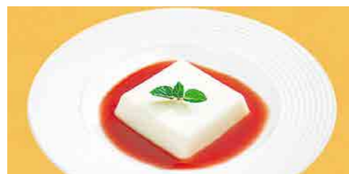
372 杏仁豆腐 山桃ソース ¥ 750