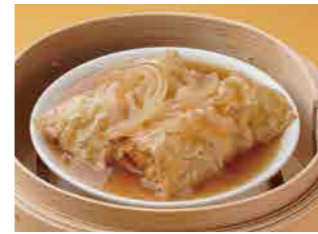
289 筍の湯葉巻き ¥900