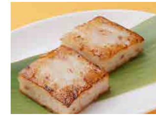
287 大根餅 ¥580