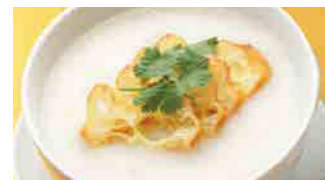
221 白粥 (Sサイズ)¥420 ¥600