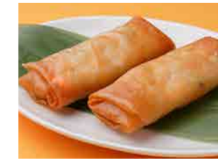
292 春巻 ¥700