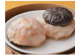
288 海老すり身椎茸重ね蒸し ¥700