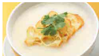
222 豆乳粥 (Sサイズ)¥420 ¥600