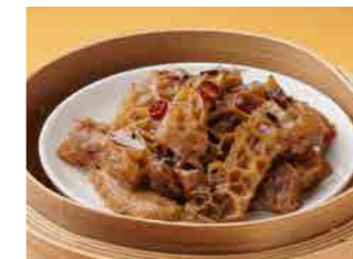
298 牛モツの黒豆ソース蒸し ¥900