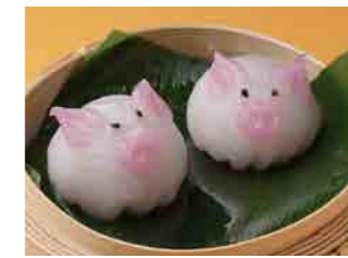
283 こぶた餃子 ¥800