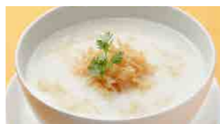
226 干し貝柱粥 (Sサイズ)¥840 ¥1,200