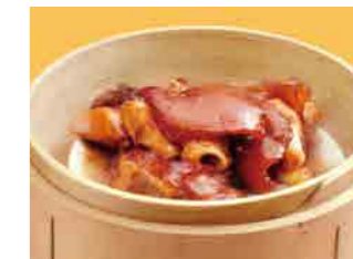
300 豚足蒸し ¥820