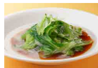
261 レタスの湯がき ¥550