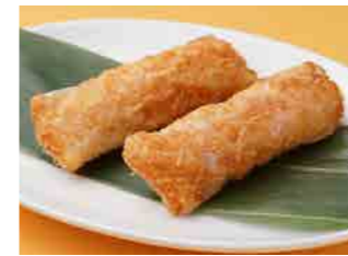
293 海老の紙包み揚げ ¥940