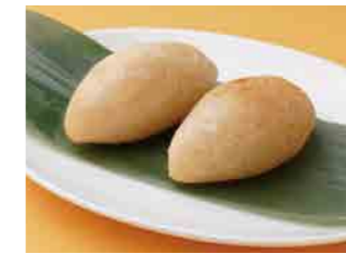
294 五目餅揚げ ¥600