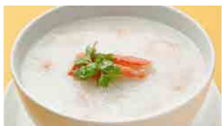
227 蟹肉粥 (Sサイズ)¥1,120 ¥1,600