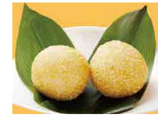
295 ゴマ団子 ¥660