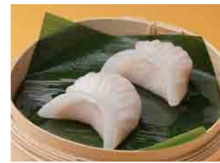
281 海老蒸し餃子 ¥480