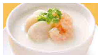
228 海鮮粥 (Sサイズ)¥1,120 ¥1,600