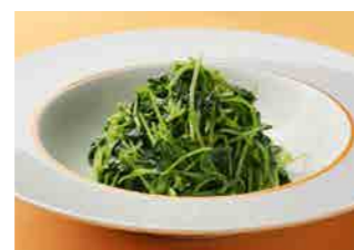
262 豆苗のニンニク炒め ¥800