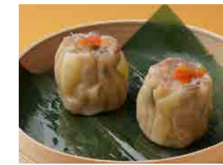
284 香港式海老焼売 ¥500