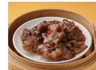
299 豚スペアリブの黒豆ソース蒸し ¥980