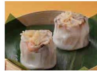
285 干し貝柱肉焼売 ¥860