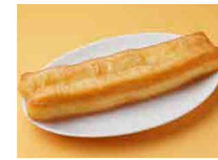
291 揚げパン (ユーツイアオ) ¥300