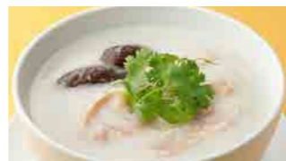
224 鶏粥 (Sサイズ)¥630 ¥900