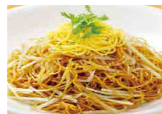
263 黄ニラ焼きそば ¥1,200