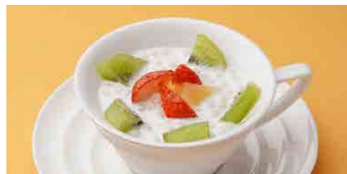
371 タピオカ入りココナッツミルク ¥ 700