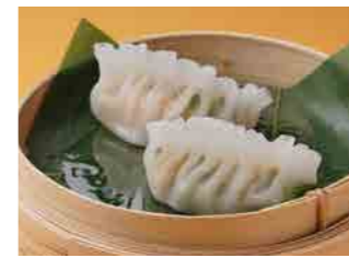
282 海老入りニラ餃子 ¥500