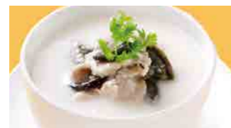
225 豚肉とピータン粥 (Sサイズ)¥770 ¥1,100