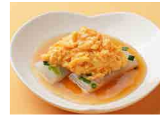
290 キシメン卵 ¥350