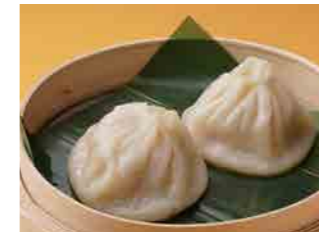
286 小籠包 ¥520