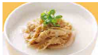
223 牛モツ粥 (Sサイズ)¥560 ¥800