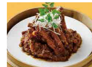
296 鶏足の黒豆ソース蒸し ¥800