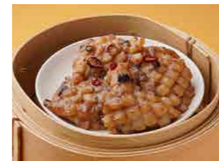
297 イカの黒豆ソース蒸し ¥1,300